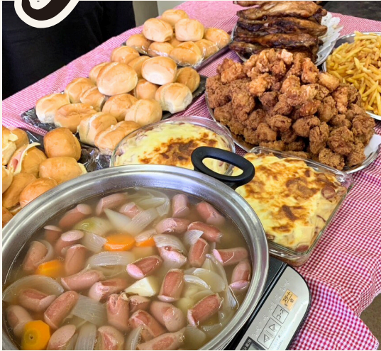
美味しく・楽しく！(サン・ワーク緑町クリスマス会)