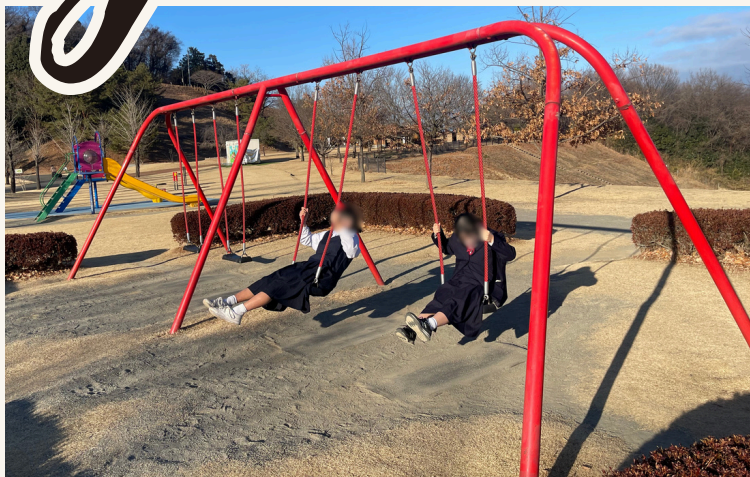
だんだんと、過ごしやすい気温の日が増えてきました！（サン・ワーク井野）